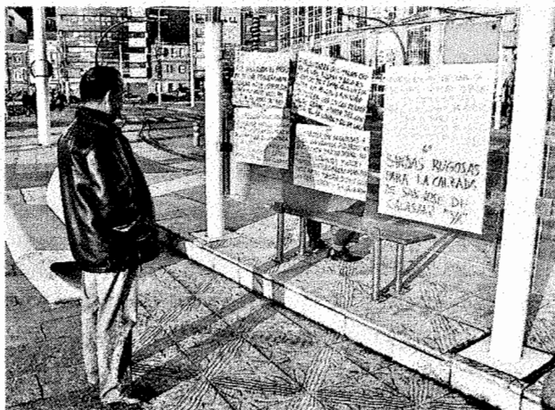
Los afectados han usado una marquesina del Paseo para hacerse notar.

"10.000 veces llamamos al Ayuntamiento, les entregamos más de 200 firmas de los vecinos, pero no nos hacen ni caso, ¿qué esperan? ¿que haya una tragedia?", cuenta una de las afectadas. Ahora, sus demandas empapan las paradas de autobús.