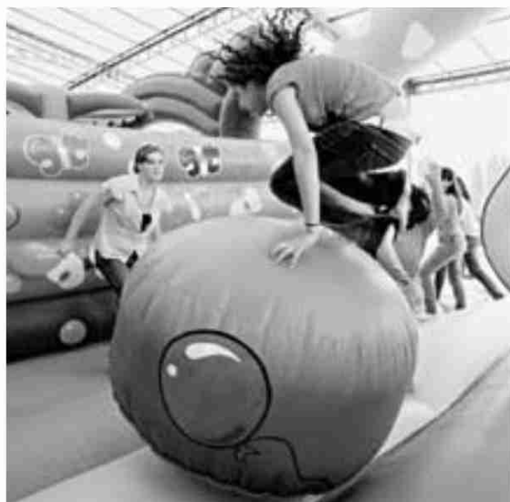
En Palexco y Vilaboa los pequeños podrán disfrutar en los hinchables | D. VILLAR

par en cualquiera de estas actividades —que son totalmente gratuitas— hay que inscribirse previamente llamando al número de la fundación, el 981 185 060.