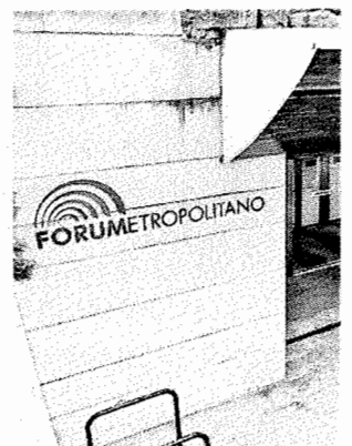
Hay cine gratis en el Forum.

Hace unos meses, el Ayuntamiento anunciaba que las áreas escolares con mayor carga de tráfico serían declaradas Zona 30 durante las horas de entrada y salida de alumnos. En San José de Calasanz les parece una buena solución, pero demandan que se aplique "urgentemente".