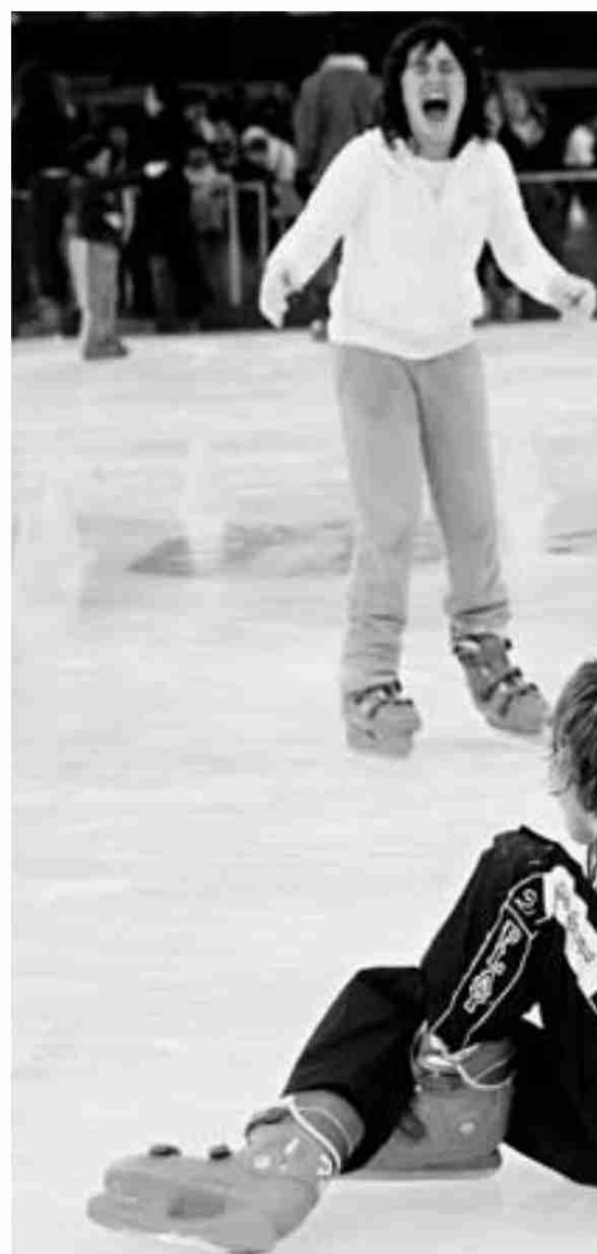
La pista de hielo del Coliseo acoge todas las vacaciones de Navidad a miles de

Durante todo el año, el Museo de Arte Contemporáneo de Unión Fenosa (Macuf) lleva a cabo un programa para acercar la música a familias con hijos pequeños. Aprovechando la llegada de las vacaciones de Navidad, continúan con este ciclo, aunque dándole un toque más festivo. De hecho, el próximo domingo 21 de diciembre, el