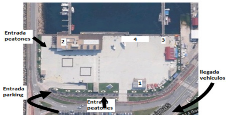
1 Aula Nautica Esfuerza: Recepción, explicación, comida. 2 Cafeteria / Aseos. 3 Zona de Embarque. 4 Gradas.