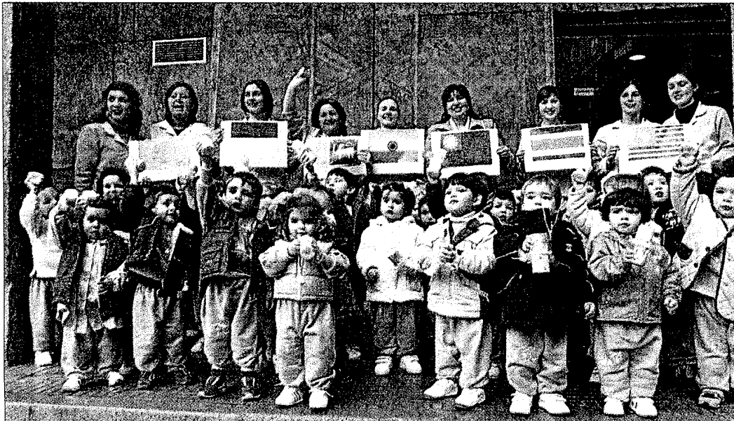
Los niños, de dos a tres años de edad, se manifestaron en la plaza Elíptica antes de pasar el día en Aventura Park

Los más pequeños manifestaron su apoyo haciendo sonar unos sonajeros