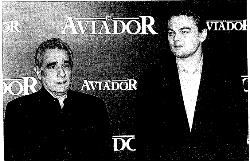
Scorsese y Di Caprio ayer, en Madrid.