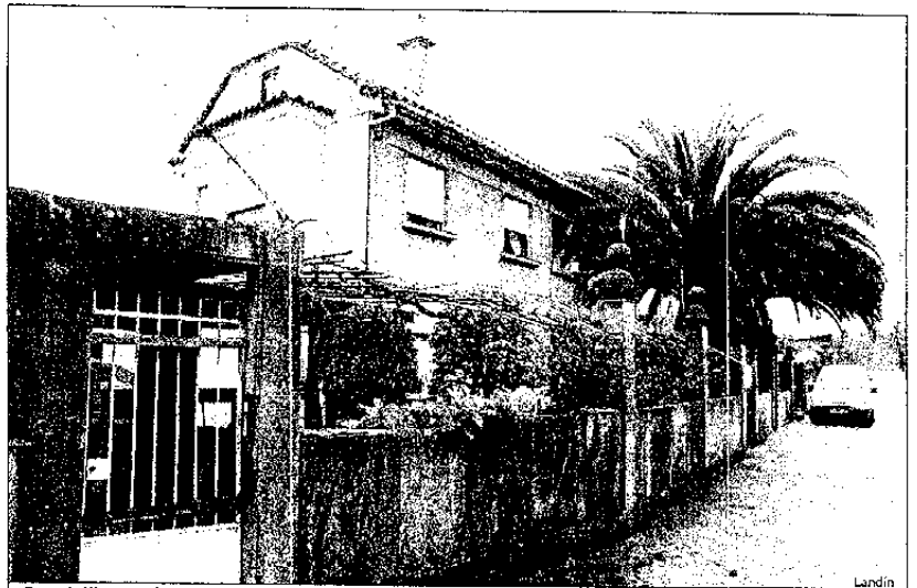
Domicilio en el que tuvieron lugar los hechos.