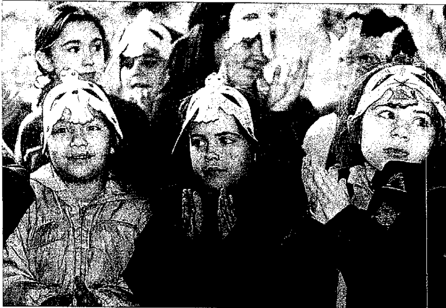
Escolares de Labaca, ayer, en la celebración.