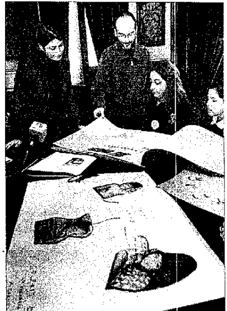
Visita de niños de Eui conto.

UNA FAMILIA es lo primero que necesita cualquier menor, según han votado los escolares de ocho colegios coruñeses. No les importó perder horas de recreo para hacer murales y cuadernos sobre la convención de derechos de