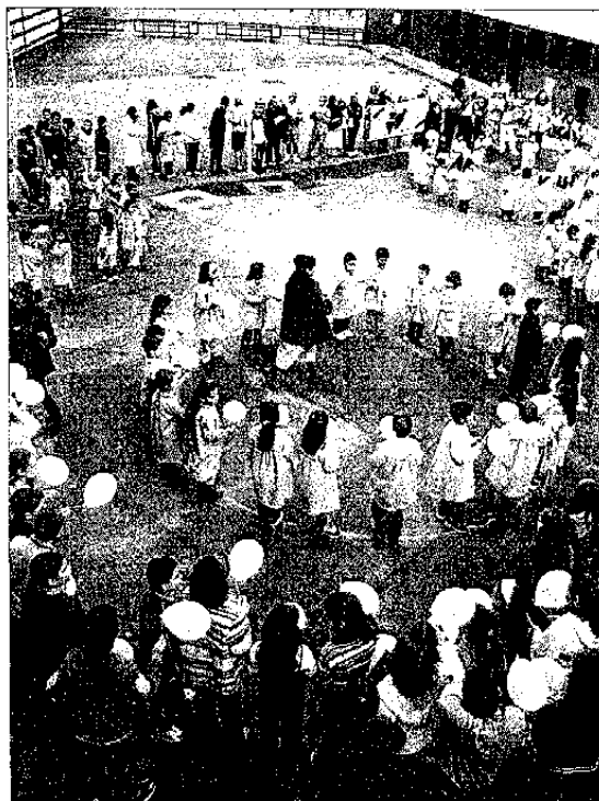
Niños del Raquel Camacho, ayer, en el patio.

Los estudiantes coruñeses homenajearon ayer a Gandhi en el 48º aniversario de su muerte