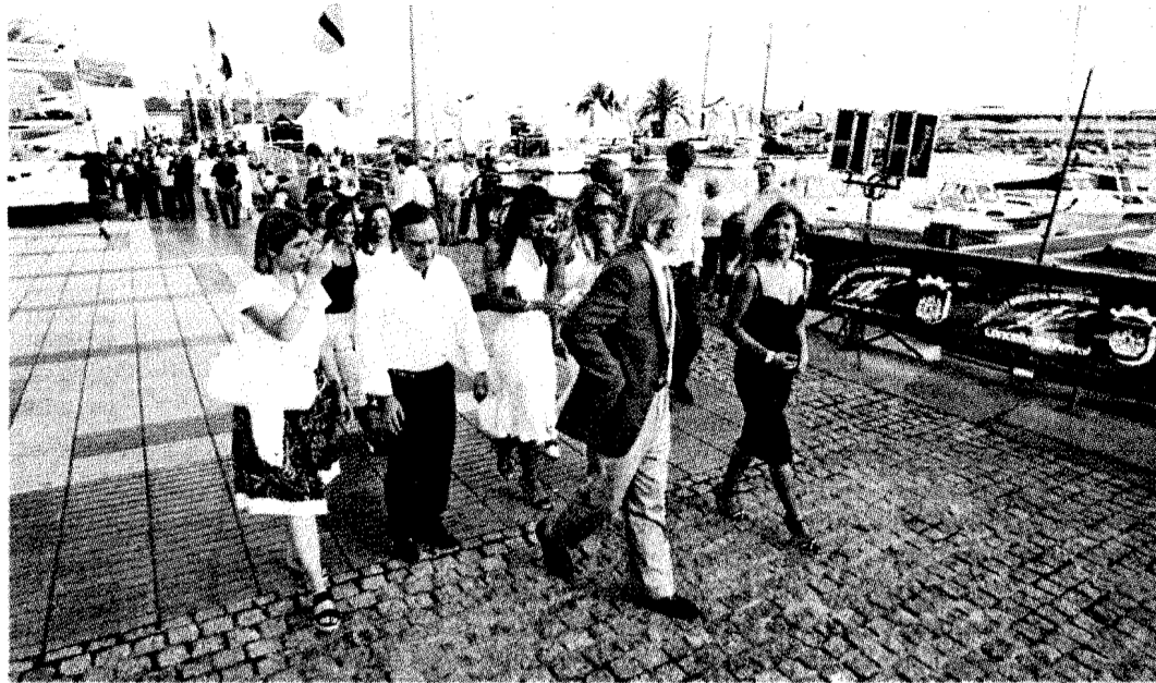
Autoridades locales y organizadores dieron un paseo por las instalaciones de Spinnaker

Buen objetivo. En esta edición, Spinnaker ha estrenado un concurso de fotografía. El tema que se propuso fue Ferrol: patrimonio de la humanidad, y el número de obras presentadas sumó el medio centenar. Después del acto oficial de inauguración, los organizadores dieron a conocer nom-