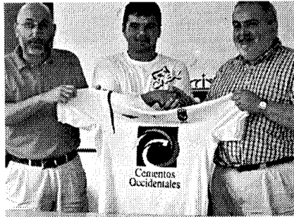
Canoli, durante su presentación

El suyo no será, ni mucho menos, el último fichaje del Cidade