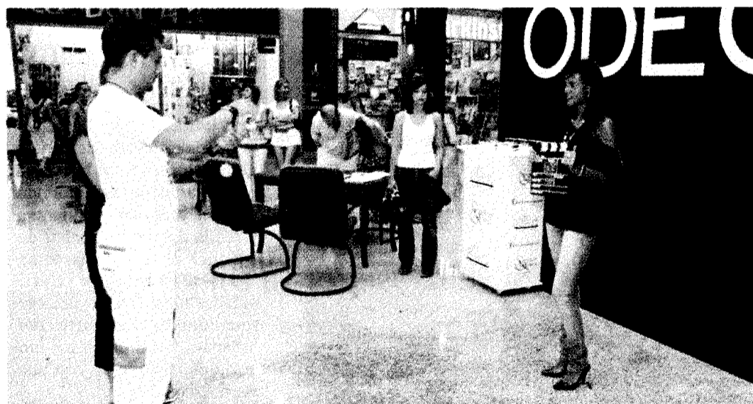
Las pruebas de selección de Miss y Mister Odeón empezaron ayer en el centro comercial