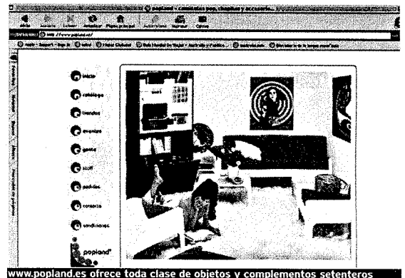
www.popland.es ofrece toda clase de objetos y complementos setenteros

Y es que lo "retro" no está refinado con la modernidad. Así que sólo tiene que conectar a la red su computadora y entrar en www.popland.es. En esta web -que tiene como base "real" una pequeña tienda de Malasaña (Madrid), convertida en los últimos tiempos en un pequeño emporio de lo "pop"- puede adquirir, tanto bolsos de charol y camisetas con motivos psicodélicos, como todo tipo de accesorios -llaveros, pastilleros, pendientes, medias y parches- de homenaje a los iconos musicales y televisivos de los sesenta y la setenta, o adquirir lámparas, posters y hasta papel de pared al más puro estilo de antaño. Todo para estar a la penúltima moda.