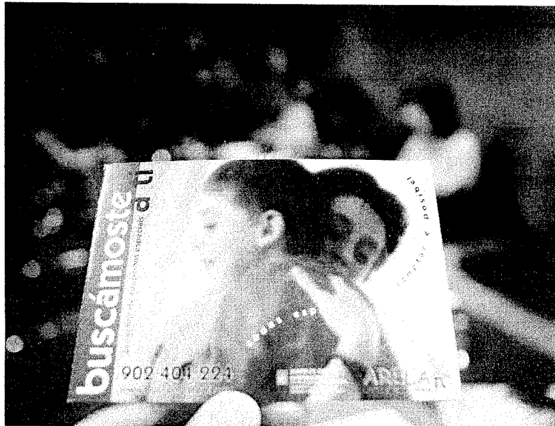
Imagen de un cartel de la campaña para integrar a los 40 menores que esperan una familia

"La adopción se basa en dar al niño una familia, no que una persona cumpla el deseo de ser padre", recordó Martínez quien destacó la alta capacidad de integración en las familias de los menores que las "sienten desde un primer momento como si fueran suyas".