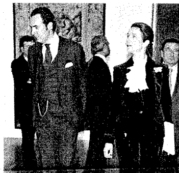
A infanta Elena inaugurou a mostra de tapices

Exposición permanente de arte contemporánea. ■ Edificio Work Center-A Grela. De 17.00 a 21.00, de luns a venres.