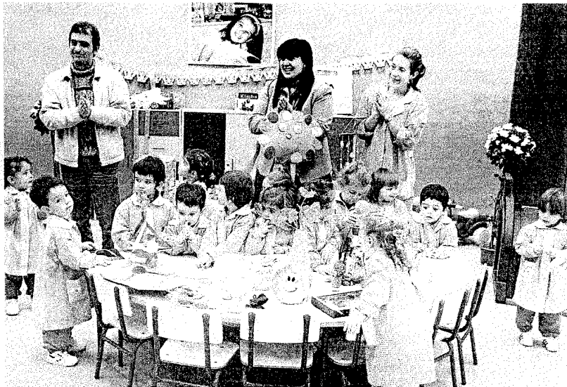
Todos los artículos que se exponen han sido realizados por niños de menos de 5 años

Ayuntamiento de La Coruña Concello de A Coruña