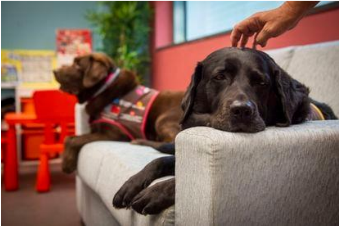
Eika y Kuba, dos de las perras que acompañan a los niños cuando tienen que declarar en una sede judicial en Madrid. JUAN BARBOSA

La Comunidad de Madrid es la pionera en España en utilizar canes para que los menores de edad testifiquen más relajados. El servicio solo lo ha utilizado un 12% de los que han declarado desde 2014