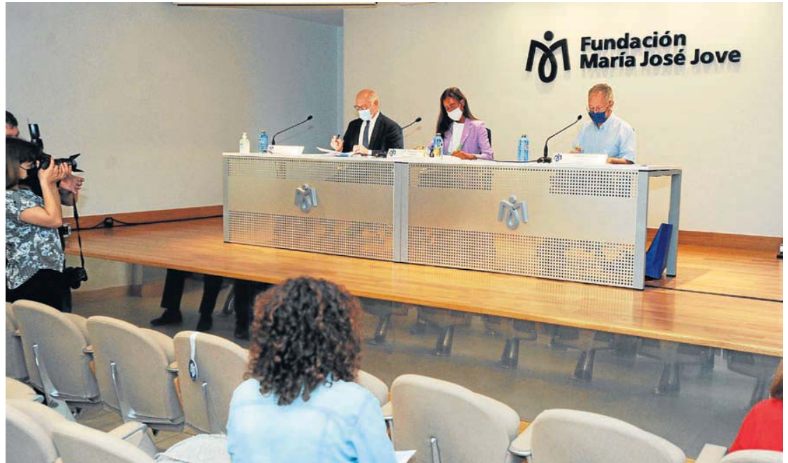
Un acto en la Fundación María José Jove

La Fundación formará previamente a los docentes y habilitará en el centro educativo un espacio con ordenador y gafas de realidad virtual. "Uno de los ejes troncales desarrollados por el MUV