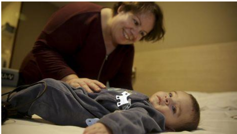
Imagen de archivo de una de las familias alojadas en el Hogar de Corazones de A Coruña

Las fundaciones María José Jove y Profesor Novoa Santos renovaron el convenio para el servicio de alojamiento gratuito de los padres de niños cardiopatas tratados en el materno del Chuac