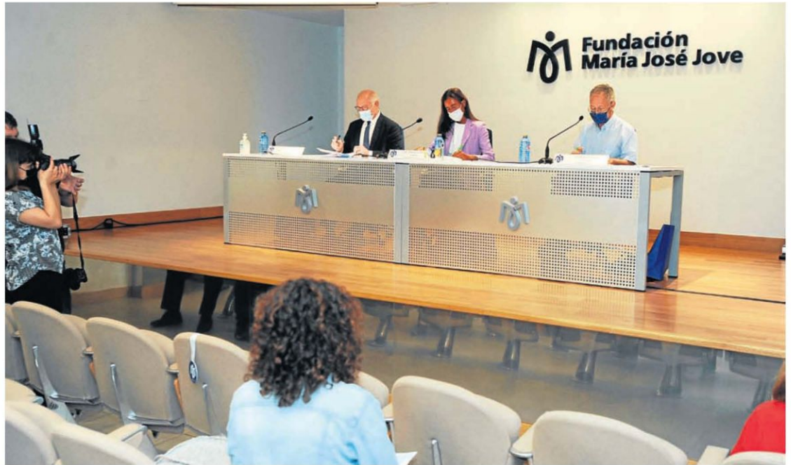
Un acto en la Fundación María José Jove

La Fundación formará previamente a los docentes y habilitará en el centro educativo un espacio con ordenador y gafas de realidad virtual. "Uno de los ejes troncales desarrollados por el MUV