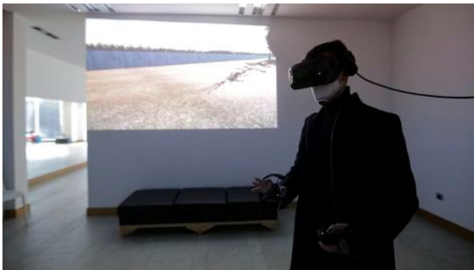
Imagen de archivo de una experiencia virtual del Museo de la Fundación María José Jove CESAR QUIAN

El proyecto busca facilitar el acceso al arte contemporáneo gracias a la realidad virtual en los centros educativos