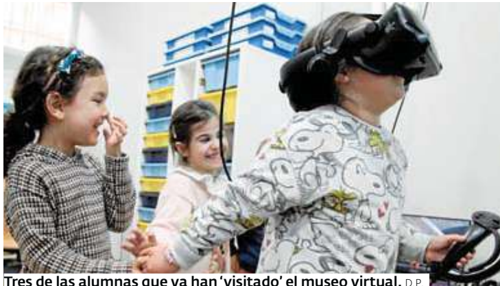
Tres de las alumnas que ya han 'visitado' el museo virtual. D.P.

La experiencia en el centro vilaboés, compuesto por las escuelas de Bértola, Figueirido, Paredes, Barciela y Pousada, se inició el pa-