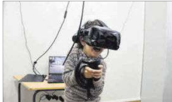
Escolares disfrutando del arte de forma virtual.

cos, junto con algunos de los resultados de la experiencia de los ocho centros educativos, serán recogidos en una publicación digital que estará disponible en la web del museo y se sumará a la ya realizada durante el curso pasado.