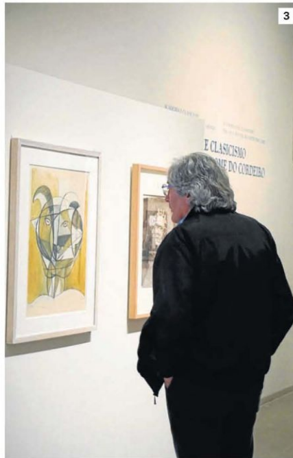
1 y 2. Los museos científicos celebraron una jornada de puertas abiertas / 3. Belas Artes contó con visitas guiadas extraordinarias y la presencia del conselleiro de Cultura / 4. La Fundación Jove celebró el día con la actividad 'Habitar un museo'