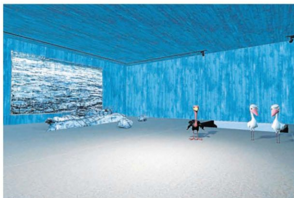
Aves del Museo virtual (MUV) de la FMJJ a las que hace referencia Pereiro

La directora remarca, al mismo tiempo, la buena acogida que ha tenido la iniciativa por parte del alumnado. “Pensabamos que ao mellor podían amosar reticencias no intre de poñer o equipo ou dificultades no seu manexo. Pero todo o contrario. É increíble ver