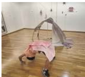
Imagen del campamento del año pasado.