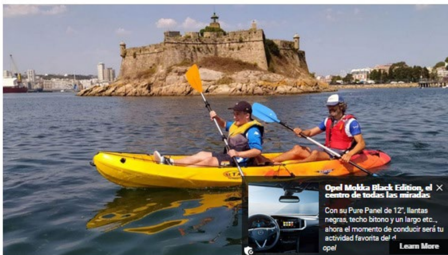
Imagen de archivo de la anterior del programa 'Esfuerzo'

El programa de actividad física adaptada 'Esfuerzo' de la Fundación María José Jove y La Caixa regresa un verano más para facilitar la práctica deportiva a personas con diversidad funcional . Los interesados podrán realiza esta temporada estival vela y piragüismo, además de participar en un programa de ayuda en la playa de Oza. Las inscripciones permanecerán a inscribirse hasta el próximo 2 de junio en la página web www.fundacionmariajosejove.org .