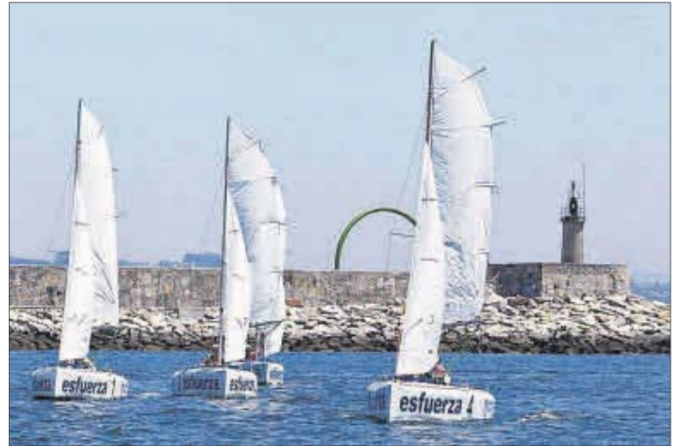
Última competición de vela disputada en 2019.

La competición abarca las categorías de vela y piragüismo adaptado, así como la de vela adaptada con acompañante para aquellos regatistas que precisen algún tipo de ayuda, favoreciendo de este modo que cualquier persona, sin importar sus capacidades, pueda participar. El objetivo es también que deportistas, entrenadores y acompañantes puedan intercambiar impresiones acerca de sus vivencias con el de-