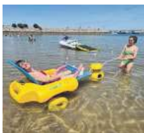
La iniciativa tendrá lugar de junio a septiembre.